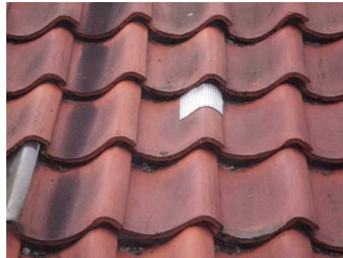
Provisorische Reparatur des Schadens

An folgenden Stellen der Dachhaut sind Ziegel geschädigt: