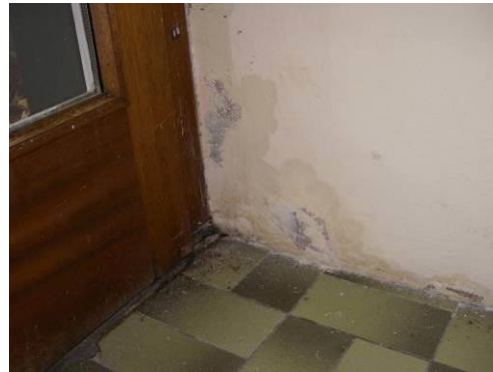
Folge: Feuchtigkeit im Inneren des Gebäudes

In folgenden Bereichen des Gebäudes sind die Fallrohre nicht bzw. nicht korrekt an eine Oberflächenentwässerung angeschlossen: