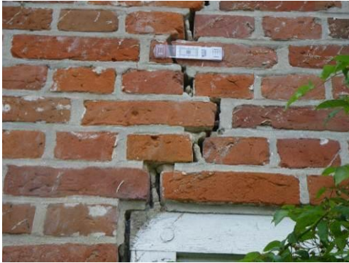
Ansicht Riss mit Rissmonitor