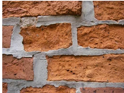
Durch den Mörtel wird die Steinoberfläche geschädigt

An folgenden Stellen sind Mauerwerksfugen mit Zement- bzw. Kalkzementmörtel überarbeitet worden: