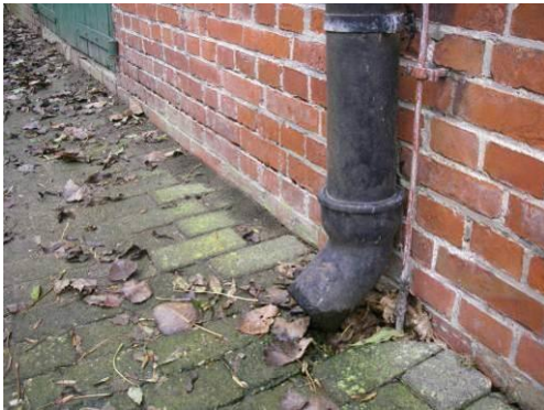
Nicht angeschlossenes Fallrohr